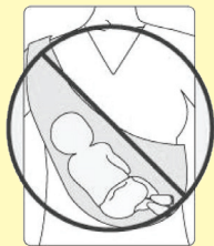
NEPRAVILN POLOŽAJ: otrokov obraz je prekrit