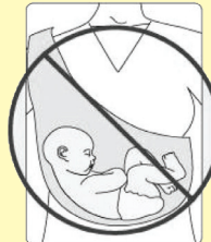
NEPRAVILN POLOŽAJ: otrok je sključen in brada se dotika prsi